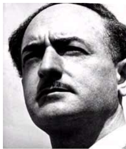
(SALVATORE QUASIMODO - poeta)