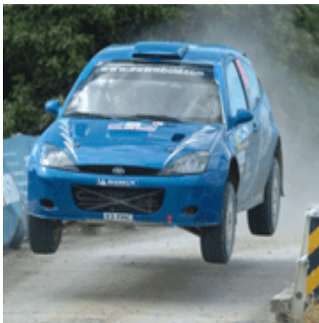
Immagini di una gara di Rally

In palio ci sarà il titolo di campione italiano assoluto e i titoli di categoria: campione Maschile, Femminile e Juniores. Ai vincitori spetterà una Alfa Romeo 147 JTD. I piloti campioni di sicurezza diverranno testimonial di una vera e propria campagna, voluta dal Ministero Infrastrutture e Trasporti, sulla sicurezza stradale.