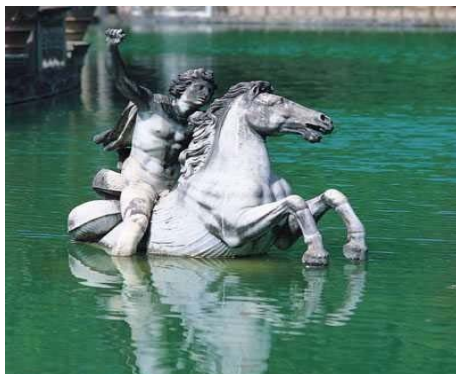
Statua del Giardino di Boboli

L'intero progetto, prima della visita vera e propria, prevede un incontro in classe, dove un attore racconta una storia aiutandosi con immagini e oggetti con cui interagire con i bambini. La stimolazione al fantastico inizia dunque in classe, con lo svolgimento di un tema partendo da una parola legata al giardino incantato. In un secondo momento prende il via il percorso teatrale nel giardino di