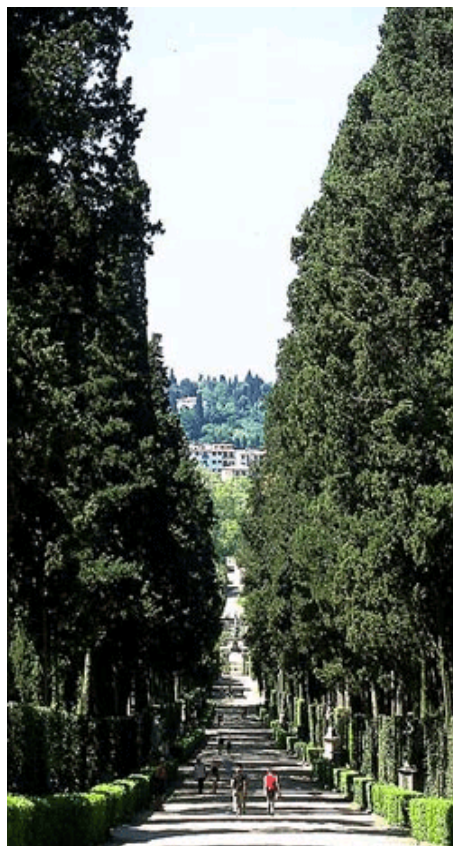
Giardino di Boboli

Il progetto si conclude con una mostra dei lavori dei bambini realizzati durante l'anno scolastico, nei locali del Teatro Rondò di Bacco a Palazzo Pitti.