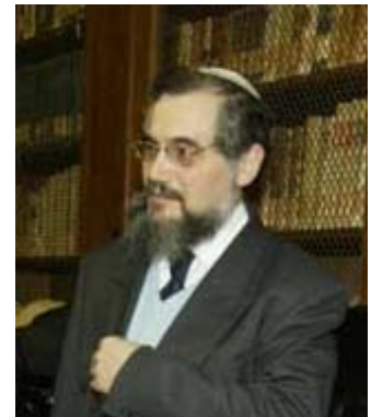
Joseph Levi Rabbino Capo della Comunità ebraica di Firenze

"E' necessario far capire ai ragazzi che tali atrocità si possono sempre ripetere perché il male, così come il bene è sempre dentro di noi. Dobbiamo insegnare loro a fare azioni meritevoli e spingerli alla bontà anziché all'odio".