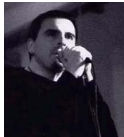
Offlaga Disco Pax Vincitori Rock Contest 2004

Sabato 16 Aprile: Auditorium Flog Via Mercati 24/B Firenze