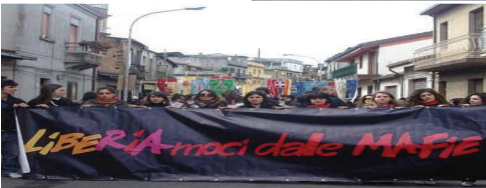
Foto realizzate dal Portalegiovani alla Giornata Nazionale della Memoria di Polistena (2007)