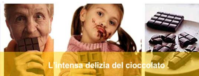
L'intensa delizia del cioccolato

Fiera del cioccolato a Firenze: dal 20 al 29 gennaio 2006 al Saschall di Firenze . Una rassegna dedicata esclusivamente al cioccolato artigianale di qualità, il vero cuore della tradizione italiana del cioccolato. Si potranno incontrare i migliori maestri cioccolatieri della Toscana e dell'Italia e provare il brivido di piacere che dà il vero, puro, divino cioccolato artigianale. Degustazioni, spiegazioni storico-culturali, giochi, spettacoli, musica. Per tutti i dettagli, orari e eventi è possibile visitare il sito ufficiale della Fiera del cioccolato www.fieradelcioccolato.it .