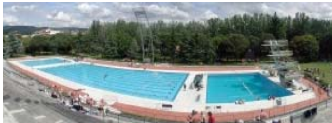
Piscina Comunale Costoli