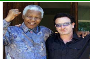
(Nella foto Nelson Mandela e Bono degli U2)

visita in Sudafrica nella quale ha incontrato Nelson Mandela . Il "46664" è il numero di matricola di Mandela nel periodo in cui fu recluso nelle carceri sudafricane durante l'Apartheid, e che è diventato il simbolo nella lotta contro l'Aids .