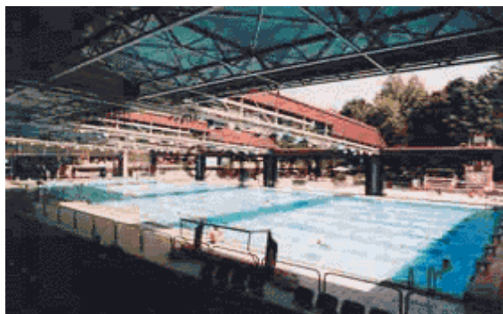
Piscina Comunale Nannini - Bellariva

Via dei Marignolli Iscrizioni: UISP - Via Bocchi 32 Tel: 055 6583501 Corsi per bambini e adulti – Aquaria - Aquabike www.uon.it/firenze/nuoto.htm