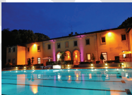
Parco piscina "Le pavoniere" Via della Catena 2 Parco delle Cascine Tel: 055 333979 - 367506 Aperto tutti i giorni dalle 10 alle 2

Piscina comunale di Bellariva Lungarno Aldo Moro Tel: 055 677521 - 677541 Attività: agonismo nuoto e pallanuoto, corsi di ginnastica in acqua, balneazione, nuoto libero, corsi di nuoto per baby da 6 mesi a 4 anni, bambini da 4 a 16 anni, adulti da 16 anni in poi.