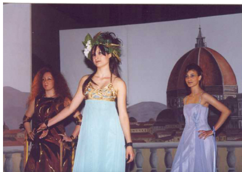
"Scuola in festa" Foto della sfilata