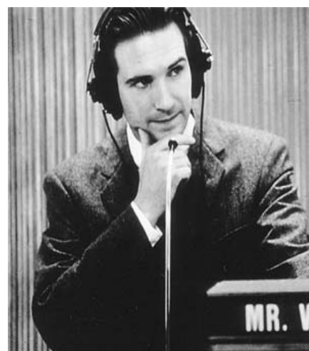
Foto tratta dal film "Quiz Show" del 1994 (Hollywood Pictures Company)

Verrà inoltre ripetuta la modalità di consegna dei biglietti direttamente ai vincitori presso la sede del Punto Giovani , in via degli Alfani n. 54 (vicino alla Rotonda Brunelleschi) così da conoscere i vincitori e comprendere così le loro opinioni e/o eventuali nuove proposte e richieste.