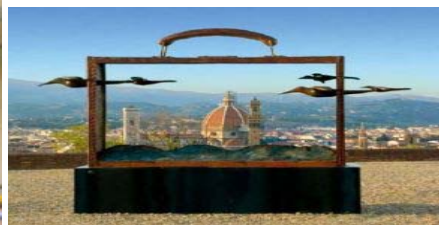
Scultura di Jean-Michel Folon

"Folon ha ricostruito delle città blu immaginarie. E niente è più vero di quelle città sulla carta. Sono le città che voleva e che le tristi città di oggi non gli avrebbero mai dato. So anche l'inattualità di tutto ciò: i limiti, le ebbrezze che ciò comporta, i rischi pericolosamente romantici. Per Folon, non conosco alcun altro punto di vista dove si senta a suo agio in accordo con se stesso. Così è per me. Si tratta di immagini e soltanto di immagini. Si tratta di un gioco di cui noi inventiamo le regole. Perché poi, possiamo giocarci. È la nostra libertà".