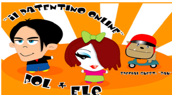
Pol, Fle e Bau: personaggi di www.patentinoonline.it

Ania - Fondazione per la sicurezza stradale - in collaborazione con il Ministero dell'Istruzione , offre un corso on-line gratuito di preparazione all'esame per il patentino per i ciclomotori . L'offerta è rivolta a chi diventerà maggiorenne dopo il 30 settembre 2005 e non è in possesso della patente di guida. L'Ania ricorda che dal 1 ottobre l'obbligo del certificato di idoneità per i ciclomotori sarà esteso ai maggiorenni non titolari di patente . Per accedere al corso basterà registrarsi sul sito www.patentinoonline.it .