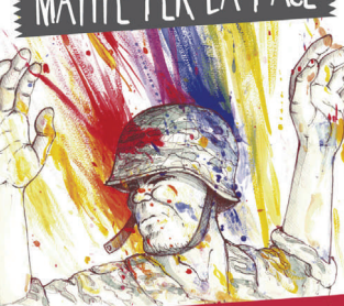
IV Edizione Concorso Nazionale per Giovani Disegnatori

Giunta al traguardo con il record assoluto di partecipazioni la IV edizione di “Matite per la Pace”, il concorso nazionale promosso dall'Ufficio Politiche Giovanili del Comune di Firenze, Informagiovani, Scuola Internazionale di Comics, Emergency Firenze e Istituto Statale d'Arte di Firenze.